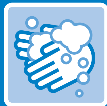
手指の洗浄、うがい